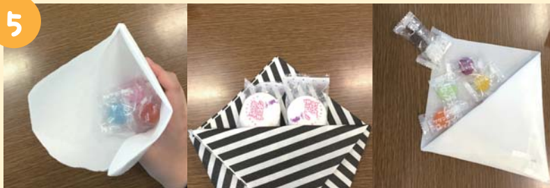
⑤ポケットに小分けになっている (軽めの) お菓子を入れて…