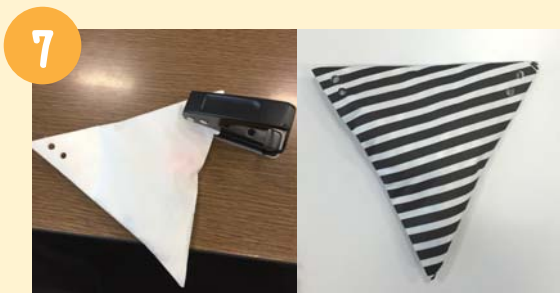
⑦・⑧一穴パンチで左右上部2ヶ所ずつ穴をあけ、黄と紫のひもを上下の穴に交互に通して…完成です♪お好みにハロウィングッズと一緒に飾り付けてもGOOD!