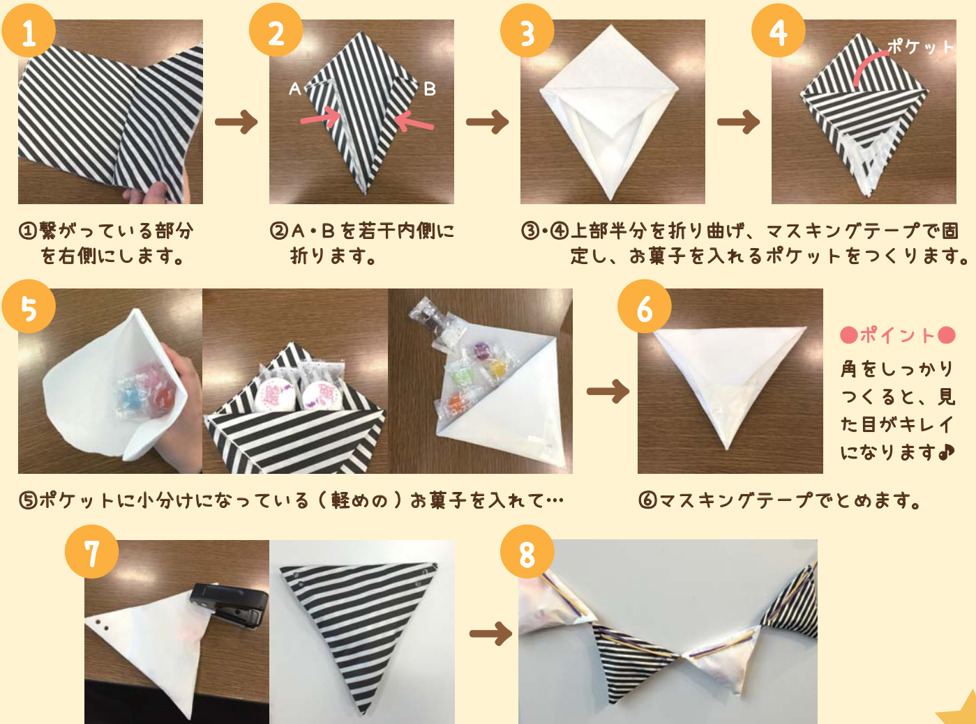
①繋がっている部分を右側にします。