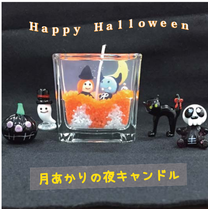
月あかりの夜キャンドル