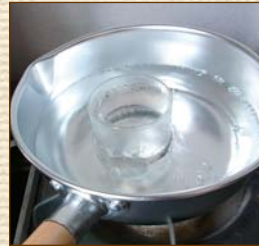
①湯せんのイメージ