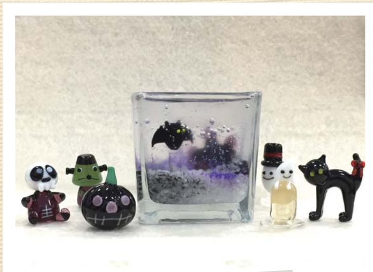
闇夜のコウモリキャンドル

★ジェルを溶かす時のコツ 沸騰しない様に注意しながら弱火で温め、スプーンを使ってゆっくりかき混ぜます。 (ジェル内に泡を作りたい時は、溶かしながら素早く混ぜると、冷やしながら固めている際に気泡が出てきます)